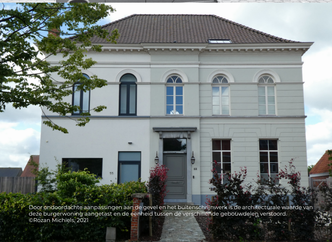
Door ondoordachte aanpassingen aan de gevel en het buitenschrijnwerk is de architecturale waarde van deze burgerwoning aangetast en de eenheid tussen de verschillende gebouwdelen verstoord.